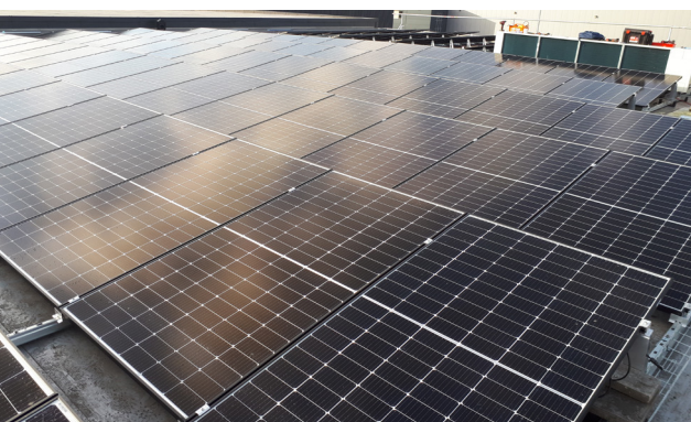
Het dak van ons pand ligt milieubewust vol met zonnepanelen.

Ook dit jaar konden wij weer een beroep doen op voldoende vrijwilligers die, dankzij hun inzet, het mogelijk hebben gemaakt dat al onze klanten wekelijks van een goedgevuld levensmiddelenpakket konden worden voorzien.